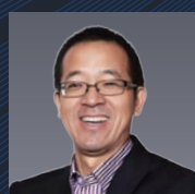
俞敏洪 Minhong YU

全國政協委員、香港總商會主席 香港上海匯豐銀行有限公司主席 CPPCC National Committee Member HKGCC Chairman, HSBC Chairman