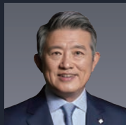
陳東升 Dongsheng CHEN

泰康保險集團創始人、董事長、首席執行官 Founder, Chairman and CEO of Taikang Insurance Group