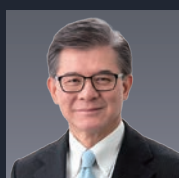
羅康瑞 Vincent Lo