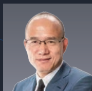
郭廣昌 Guangchang GUO

恆隆集團及恆隆地產董事總經理 Managing Director of Henderson Land Group and Henderson Land